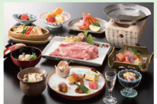
※グルメ料理 写真は料理の一例です